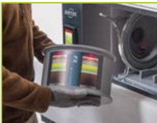
1 Gerät auspacken, Gehäusefront öffnen und Filter entnehmen

Die Anlieferung der FlameFlex- und ChemFlex-Schränke erfolgt in ihren zwei Einzelkomponenten. Nachdem der Schrank aufgestellt ist, können Sie den Umluftfilteraufsatz mit nur wenigen Handgriffen in Betrieb nehmen. Die Installation der steckerfertigen Umluftfilter-Technologie können Sie ganz einfach selbst durchführen. In vier Schritten ist ihr Gerät betriebsbereit: