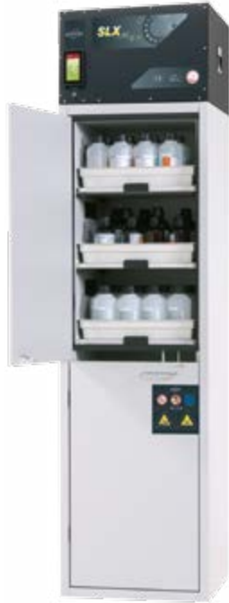
Umluftfilterschrank Modell SLX.230.060.MH in Lichtgrau (RAL 7035), Inneneinrichtung mit 6x Tablarauszug** Bestell-Nr. 32939-001-30615