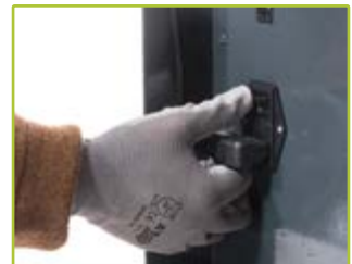
4 Kaltgerätekabel einstecken und Gerät einschalten