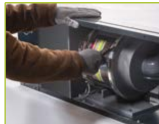
3 Filter einsetzen, befestigen und Gehäusefront schließen