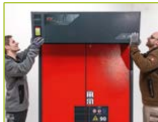
2 Aufsetzen des Umluftmoduls auf den Schrank und Verbindung zur Schrankentlüftung herstellen