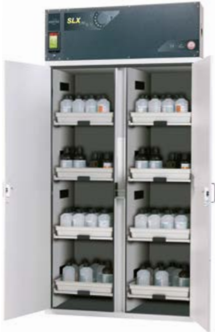
Umluftfilterschrank Modell SLX.230.120.MV in Lichtgrau (RAL 7035), Inneneinrichtung mit 8x Tablarauszug** Bestell-Nr. 32936-001-30607